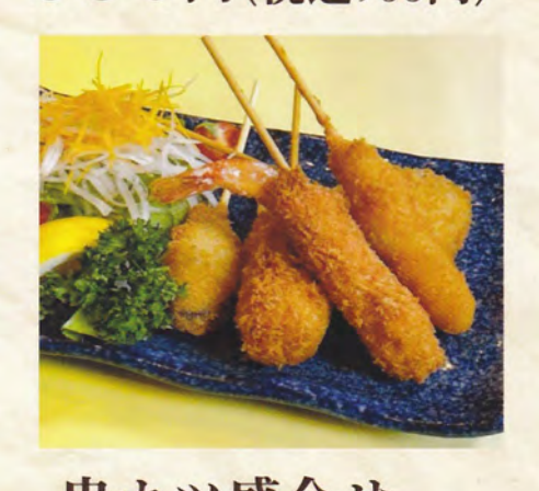
串カツ盛合せ 5本 700円 (税込770円) 10本 1,300円(税込1,430円)