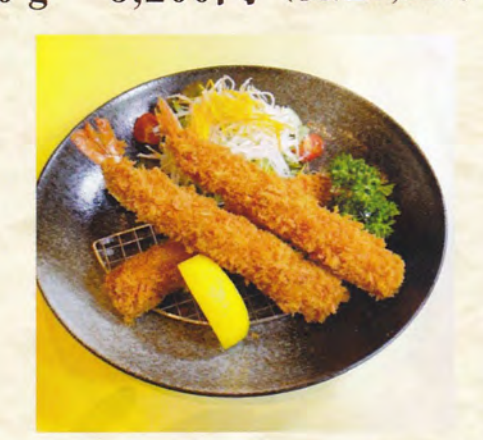
大海老フライ 3本 1,100円 (税込1,210円)