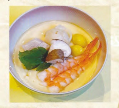
八光亭茶碗蒸 (いうどん入り) 700円(税込770円) 茶碗蒸し450円(税込495円)