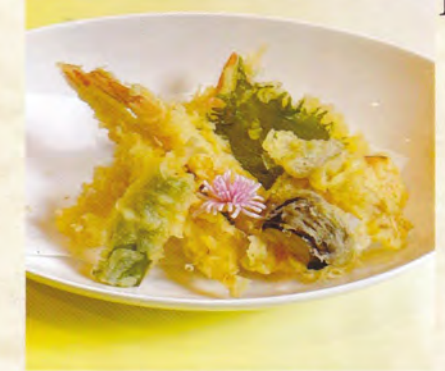
若鶏唐揚げ 海老と野菜天麩羅 1,200円 (税込1,320円)