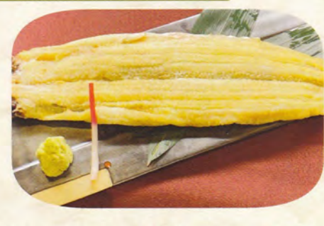
上うなぎ蒲焼き・白焼き 3, 300円(税込3,630)