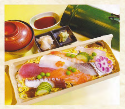
海鮮ちらし 1,800円(税込1,980円) 1,500円(税込1,650円) 2,800円(税込3,080円)