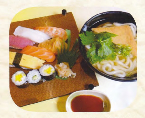
うどん又は蕎麦 寿司膳月 (温・冷) 1,300円 (税込1,430)