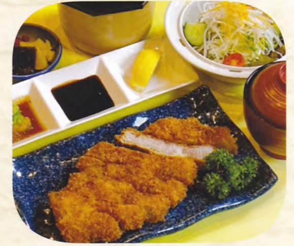
京都ぽーく ロースカツ膳 1,300円(税込1,430円) 単品 1,000円 (税込1,100円)