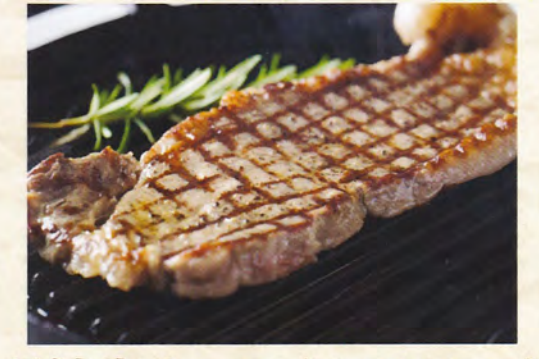
丹波牛サーロインステーキ 100g 1,800円 (税込1,980円) 3,200円 (税込3,520円) 180 g