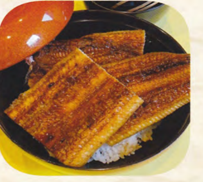
上うな丼 肝吸い付 3,500円 (税込3,850円)