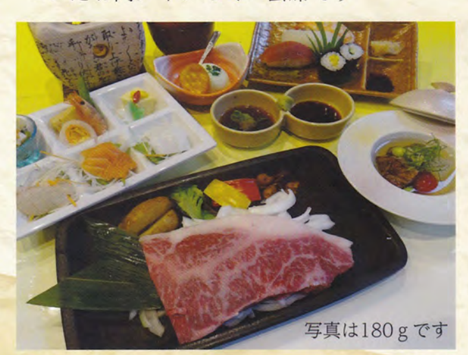
丹波牛サーロインステーキ会席 100g 2,980円(税込3,278円) 180g 4,380円(税込4,818円)

丹波牛ロースの鉄板焼に前菜・お造り 炊合せ・天麩羅・茶碗蒸し・ご飯・デザートが ついたお肉メインのミニ会席です