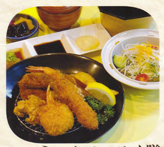
ミックスフライ膳 1,500円 海老フライ・ロースカツ ・唐揚げ・蟹コロッケ (税込1,650円)

よくばり御膳丹波牛ハンバーグをメインに 付出し・お造り・ミックスフライ 2,000円 がついたよくばりメニューです (税込2,200円)