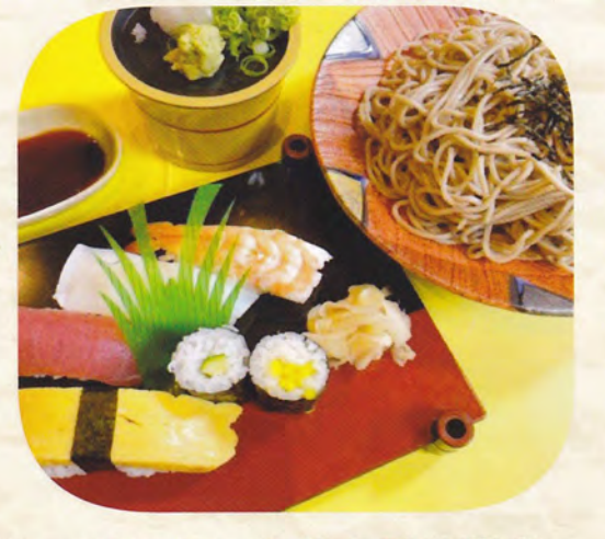
うどん又は蕎麦 寿司膳 花 (温・冷) 1,100円 (税込1,210円)